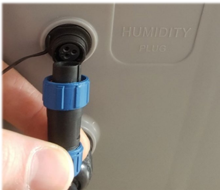
Figuur 2: hygrostaat aansluiting